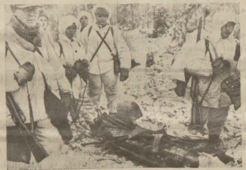
Fin cephesinde Finliscadi bir cephane arabasıyla cephane sevki

Vaşington, 7 (a.a) — Fili- pinlerde 24 saat zarfında düş- man az faaliyet göstermiştir. Düşmana karşı muvaffa- kiyetlerimiz düşmanın plan- larını altüst etmiştir.