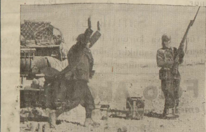
Libyada esir edilen bir İtalyan tankı

Roma 7 (a.a) — İtalyan tebliği; Libyada Tamimi bölge- sinde mevzilerimize kadar sokulan düşmana karşı hü- cumlar yapılarak püskürtül- müştür. Düşman iki makinelî vasıta bırakmış ve bir kaç esir vermiştir. Düşmanın bir kaç uçağı tahribedilmiştir. Düşman Bingazi ve trablus- garbi bombalamıştır. Maltaya hava kuvvetlerimiz şiddetli hücumlar yapımlardır. Al- man avcı uçakları iki düşman tayyaresi düşürmüştür.